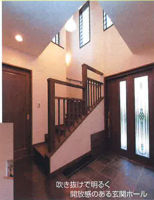
吹き抜けて明るく開放感のある玄関ホール