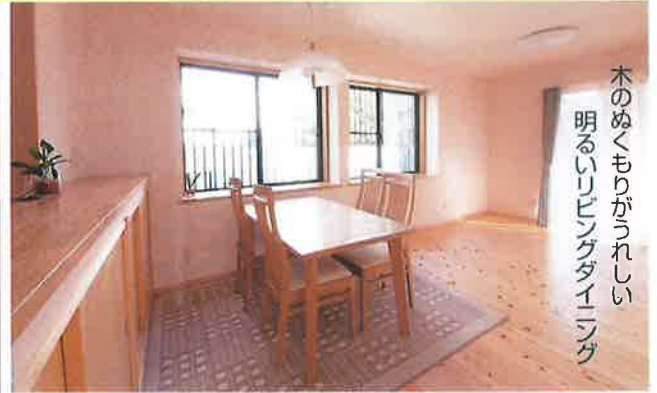
木のぬくもりがうれしい 明るいリビングダイニング