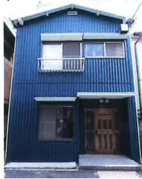
※2016年度モニター施工例