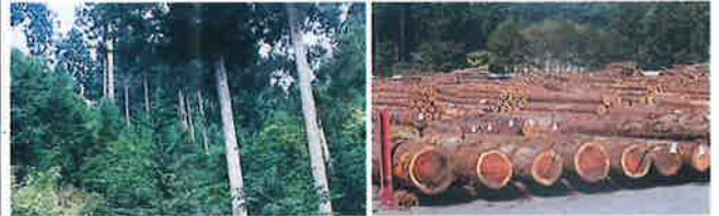
東京の木で家づくり (多摩産材)