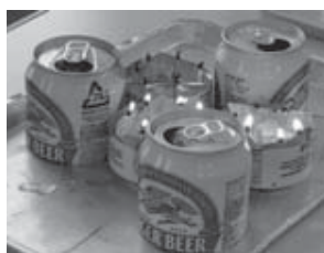
▲手作り桌上コンロ

ライフラインがストップ！そんなときに役立つ炊き出し訓練とアルミ缶を使った灯り作りとコンロ作りを体験。他に災害時に役立つ知恵と怪我人搬送方法を体験しながら学びました。ハイゼックス米って美味しいんですね！お代わりしてしまいました。