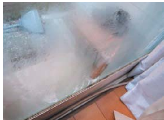
我が家の結露の状態

皆さん！今のうちにどんどん申請してくださいね。私の分までポイント貰ってくださいーい！詳しくは、4ページ5ページを読んでください。