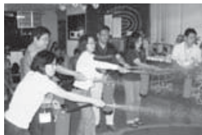
▲池袋防災館の写真

東京都内にある防災館のうち池袋防災館に行き、いっここで起こるかわからない災害に備えて、被害映像や起震体験、煙体験、消化体験を通して災害の状況を知るとともに、災害に遭遇したときの対処方法を学びました。煙であればほど視界が悪くなるとは。