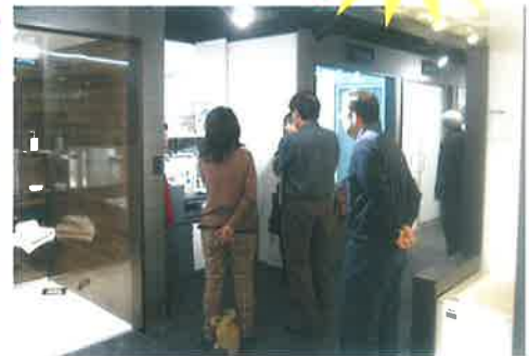
タカラショールーム見学会