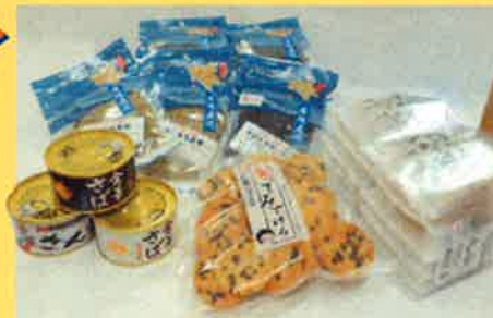
プレゼント商品 (季節によって商品が変更になることがあります)